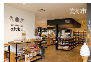
道の駅おふく お買い物クーポン（1,500円分）