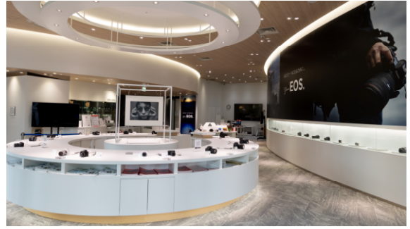
キヤノンフォトハウス大阪

キヤノンフォトハウス銀座・大阪会場では、銀座および大阪で10点ずつ、計20点の鉄道写真をパネルで展示します。