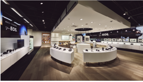
キヤノンフォトハウス銀座