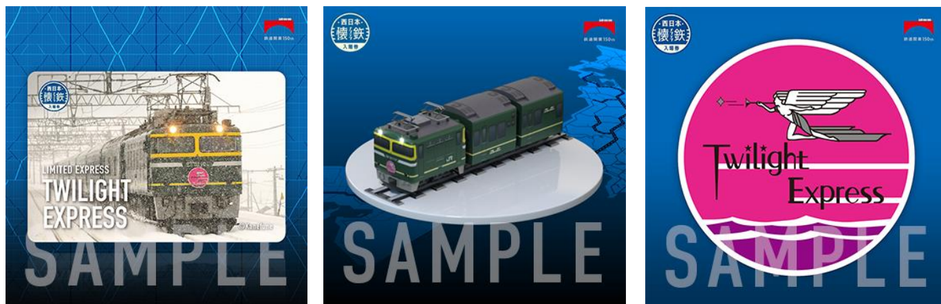
トレーディングカード NFT(左)、3D フィギュア NFT(中央)、トレインマーク NFT(右)のイメージ(『トワイライトエクスプレス』シリーズ)

32種類の列車ごとに、①トレーディングカード NFT、②3D フィギュア NFT、③トレインマーク NFT の3つのタイプ(合計96種類)を2022年10月14日(金)から11月14日(月)まで、毎日12時(正午)に1列車ずつ32日間連続で発売します。