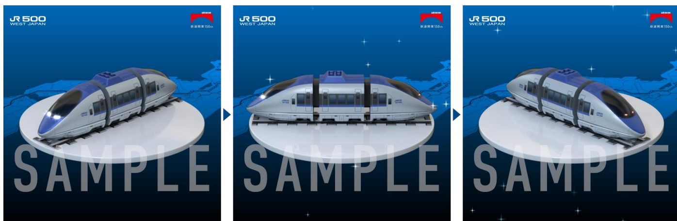
『500系新幹線 NFT』動画イメージ

『JR西日本 懐鉄 NFT コレクション』の発売に先駆けて、日比谷公園(場所:東京都千代田区)において4年ぶりに開催が予定されている『第29回鉄道フェスティバル』にあわせて、2022年10月8日(土)10時から、JR西日本を代表する大人気車両『500系新幹線 NFT』(3Dフィギュア NFT)を数量限定500個、1,500円(税込)で発売します。