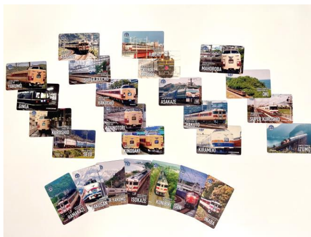
紙製トレーディングカードイメージ

*4 配布されるカードはおひとり様1枚限りで、図柄の指定や交換はできません。各日数量限定、無くなり次第終了。