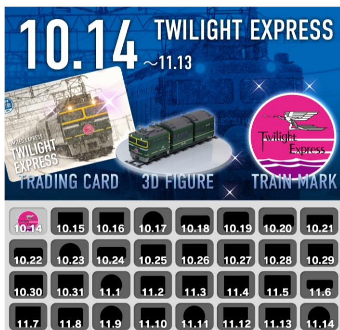
『JR 西日本 懐鉄 NFT コレクション』特設ホームページ上での発売カレンダーのイメージ

※1 販売終了後であっても、マーケットに二次流通した NFT を手に入れられる可能性があります。