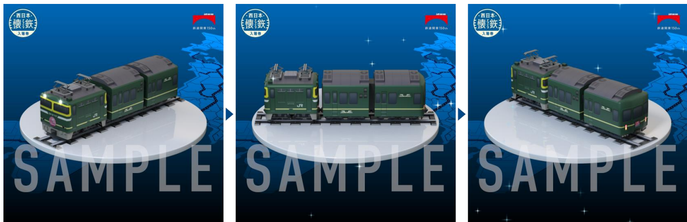
3D フィギュア NFT 動画イメージ (『トワイライトエクスプレス』シリーズ)

※2 「ハイケンスのセレナーデ」・「アルプスの牧場」は、本 NFT のためにオルゴールを再現して制作した電子メロディです。