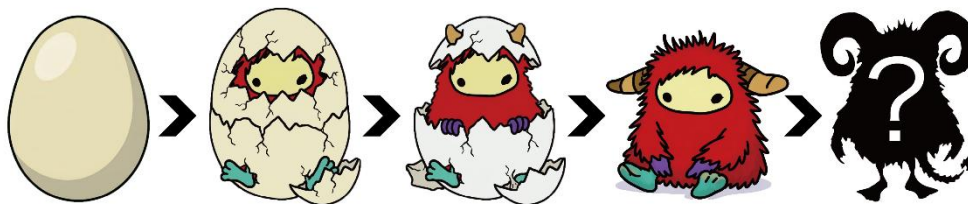
絵・手紙・音声の心のかげらを食べて成長させよう!