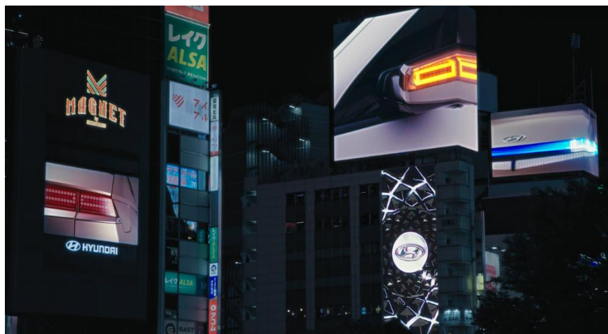
▲EV [IONIQ 5]