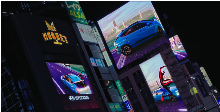
▲EV [KONA Electric]