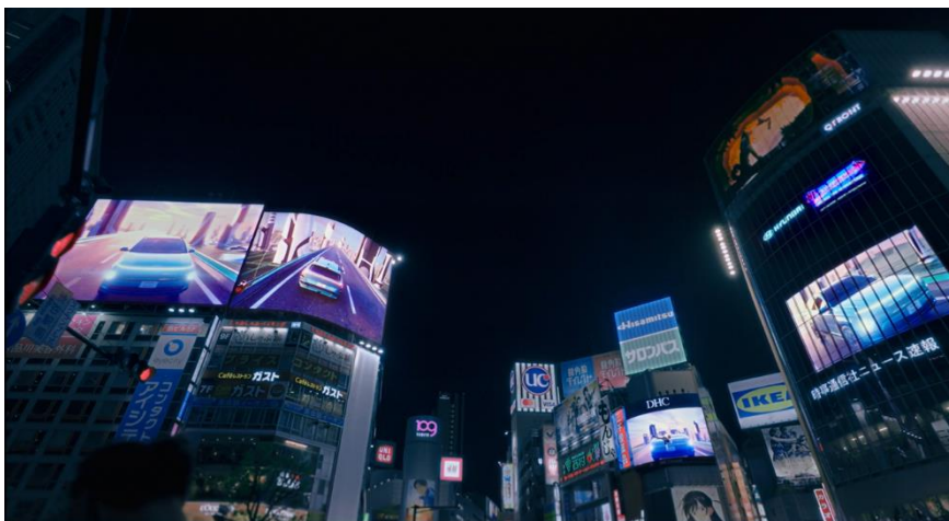
▲EV 「KONA Electric」