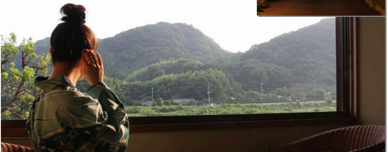
客室より望む風景