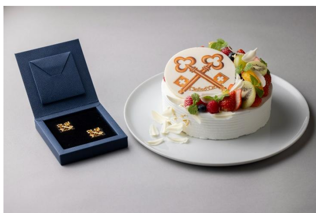
レ・クレドール襟章と記念ケーキ