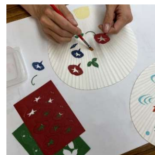
都うちわ 和紙貼り絵 絵付け体験 (塩見団扇株式会社) 2,000 円／20～40 分