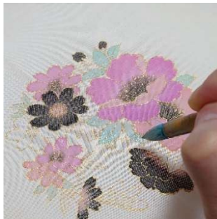
手描友禅「色挿し」 (彩色) 体験 (染工房正茂) 3,500 円～／60 分