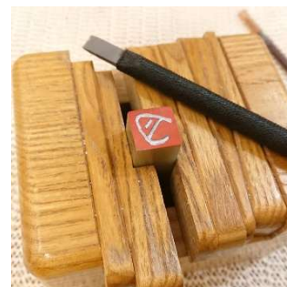
石のハンコ作り 篆刻体験 (河政印房) 3,000 円／60～90 分