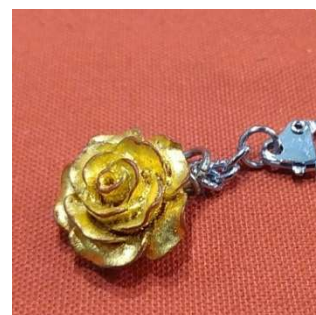
金箔貼り体験 (京金箔押 常若) 1,500 円～／20～40 分