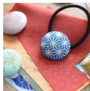
京友禅の金彩体験 (takenaka kinsai) 1,000 円／30 分