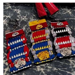
絨(おどし)体験 (工房武久) 4,500 円～／60 分