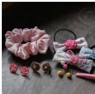
水引アクセサリ作り (株式会社やまひで) 1,500 円～／30 分

※ワークショップの体験内容・時間・価格は変更する場合がございます。あらかじめご了承ください。