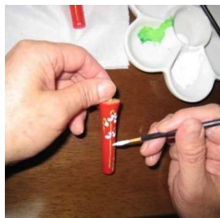
和ろうそく絵付け体験 (有限会社中村ロソク) 1,500 円／30 分