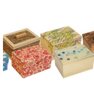
指物キット「サシモノッチ」 を使った桐箱製作体験 (函七工房) 2,500 円／30 分