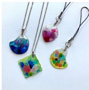
七宝体験 (京七宝ヒロミ・アート) 2,500 円～／30～60 分