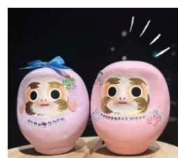
画像：体験イメージ

桜色、藤色、若草色の 3 色の中からひとつ選び、 デコレーションをしてオリジナルだるまをお作りいただけます。