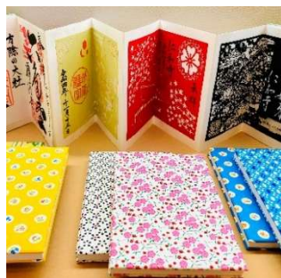
御朱印帳・豆本作り体験 (株式会社西川紙業) 2,000 円～／30 分