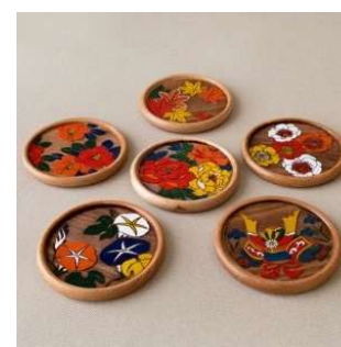
木皿絵付け体験 (三彩工房株式会社) 1,500 円／30 分