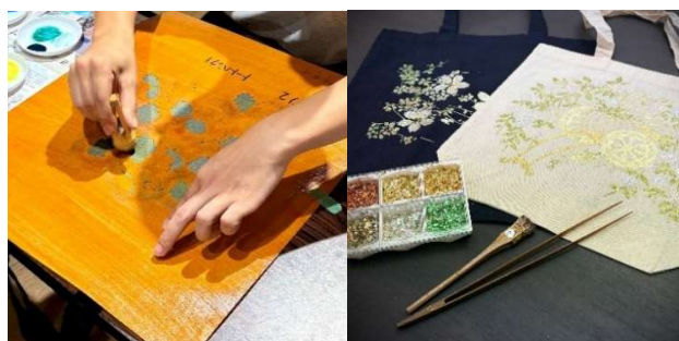
コラボワークショップ | 京友禅の型友禅・金彩体験 (岩井染工・田中金彩工芸) 4,000 円 ~ / 40 分 ~ 50 分

ホテル M3F クラフト & アートショップ「アトリエジャパン」でも同日にワークショップを実施 はッピーだるまを作ろう！