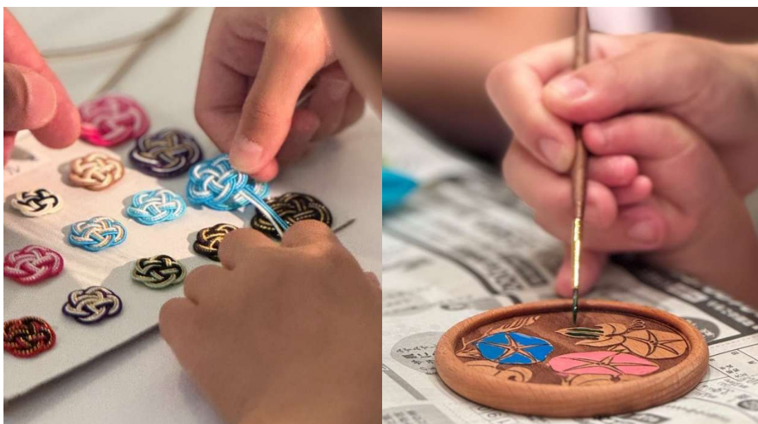
画像：水引アクセサリ制作体験・木皿絵付け体験 イメージ

また同会場にて、学べる体験コーナー「“おだし” のひみつ」を開催いたします。日頃ご家庭で使われている、和食文化に欠かせない出汁がどのようにできあがるのかを学べるほか、昆布に実際に触れたり、味の変化を比べたりできる体験をご用意しております。