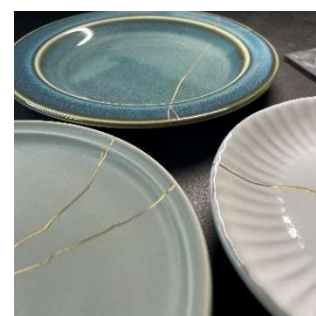
金継風 金粉蒔き体験 (金継ヒラタ) 3,000 円～／60 分～90 分