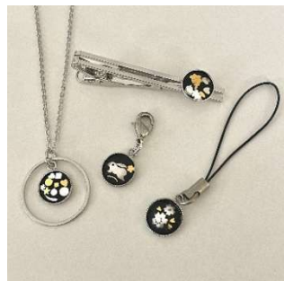
象嵌（ぞうがん）体験 (株式会社中嶋象嵌) 2,500 円～／40～60 分