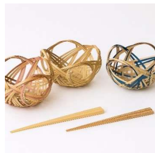
竹工芸体験 (長岡銘竹株式会社) 2,500 円～／20～30 分