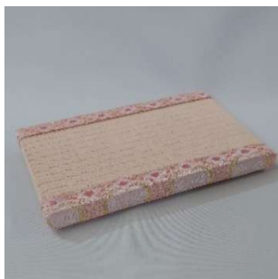
押し畳制作体験 (有限会社 太田畳店) 2,000 円 / 20 分