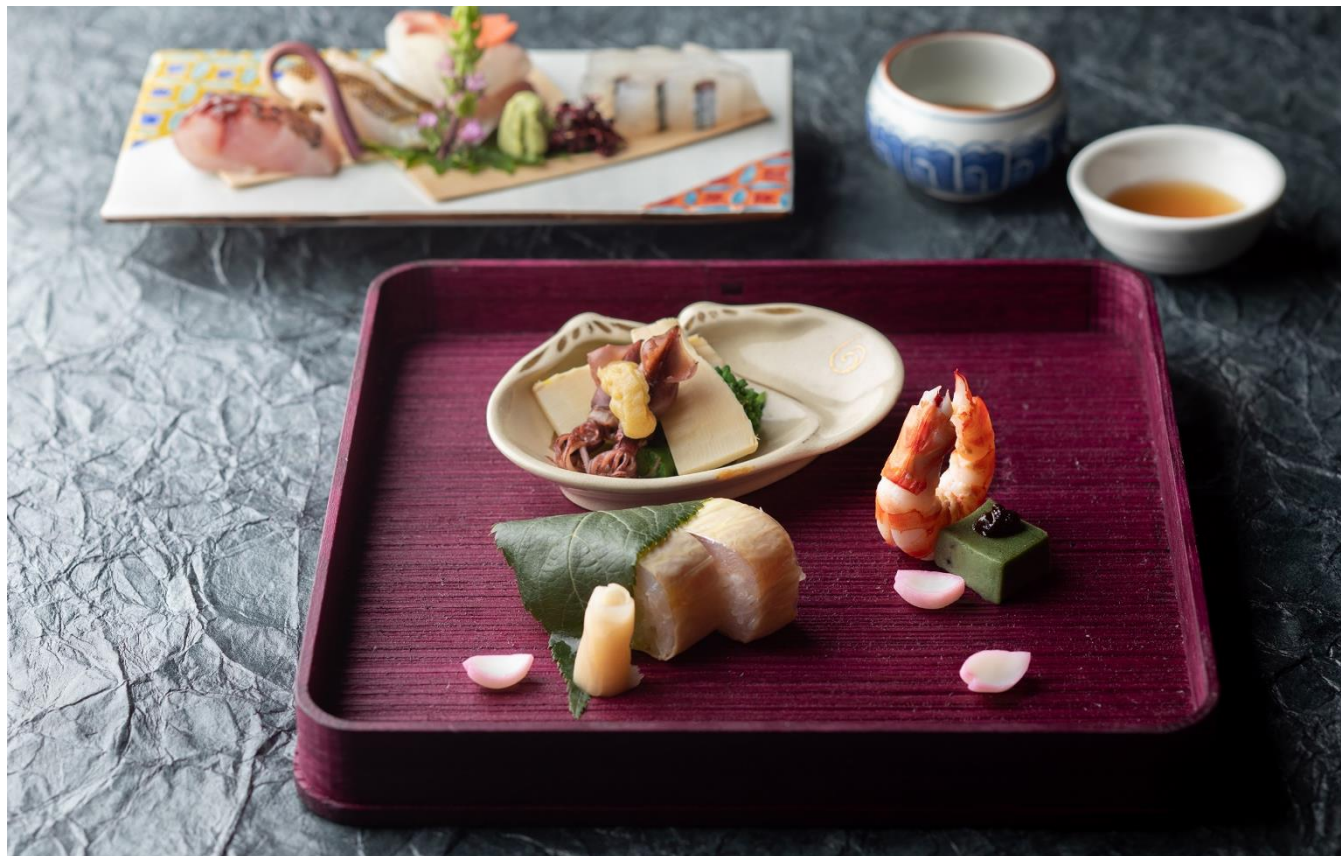
画像：和食「浮橋」の京都フェア会席 京舞華 料理イメージ

こちらのお料理は、ホテル内レストランの5店舗のフェア対象メニューの中でお楽しみいただけます。