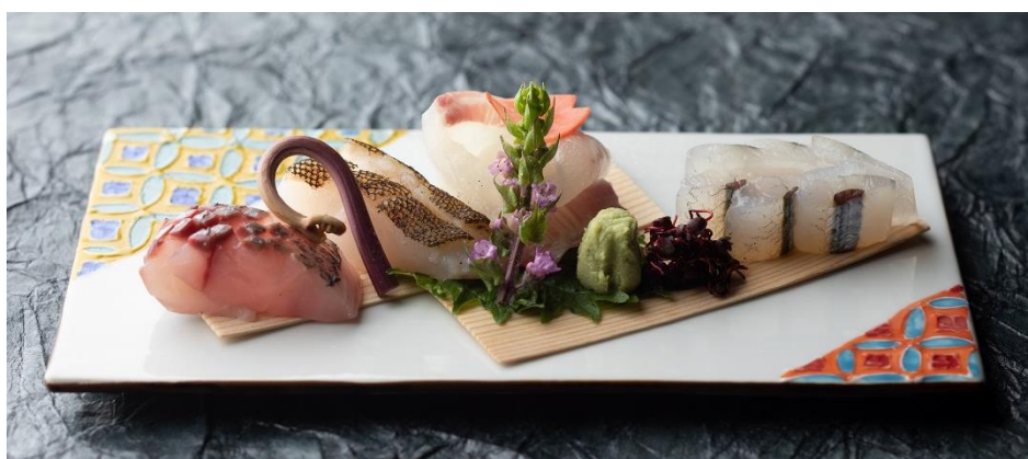
画像：シェフのイラスト(左)、完成した器・和食「浮橋」の会席に登場する京都の海鮮盛合せイメージ(右)