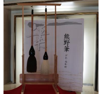
東側玄関 付近 「熊野筆」