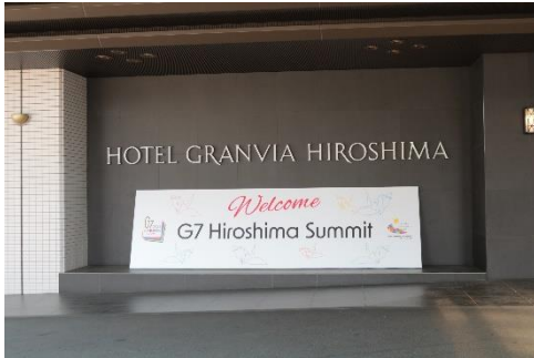
西側正面玄関 横 「ウェルカムボード」