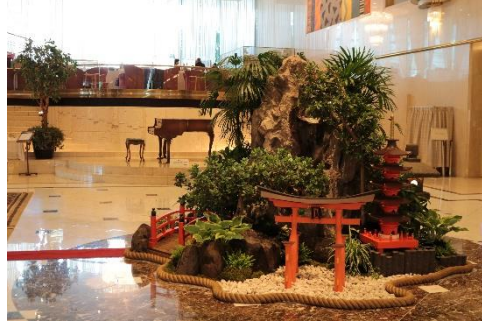
フロントロビー 「宮島庭園」