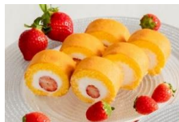
沖美いちご ロールケーキ