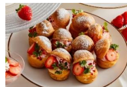
沖美いちご シュークリーム