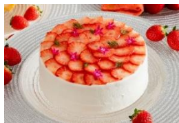
沖美いちご ショートケーキ