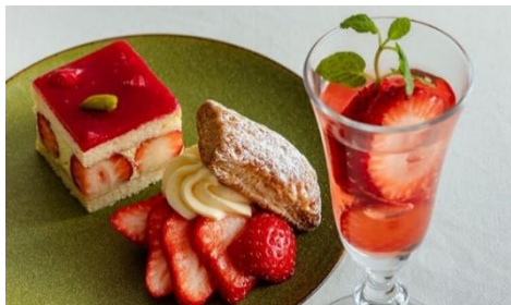
いちごの特徴を最大限に引き出した ウェルカムスイーツ