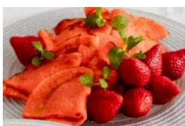
あまおう カスタードクレープ

沖美いちご ショートケーキ、ロールケーキ、シュークリーム、 ピスタチオのタルトレット など