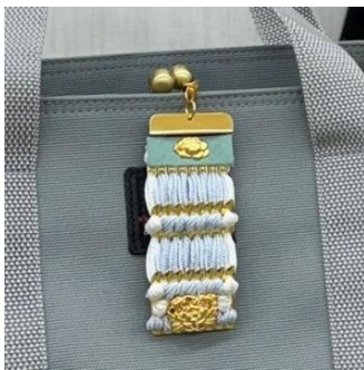
絨（おどし）体験 （工房武久） 4,000 円／30～50 分