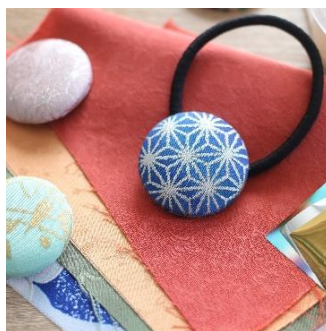
金彩体験 （takenaka kinsai） 1,000 円／30 分