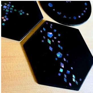
貝（螺鈿）体験 （Nao 漆工房） 2,000 円～／40～60 分