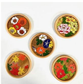
豆皿絵付け体験 （三彩工房） 1,500 円／30 分