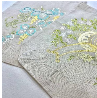
京友禅の金彩体験・トートバック (田中金彩工芸) 2,500円/30分