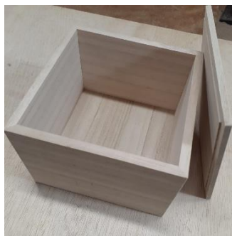
指物体験・桐箱作り （京指物 函七工房） 2,000 円／30～40 分