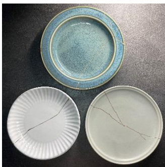
金継の仕上げ体験 （金継ヒラタ 金継工房） 3,000 円～／60～90 分