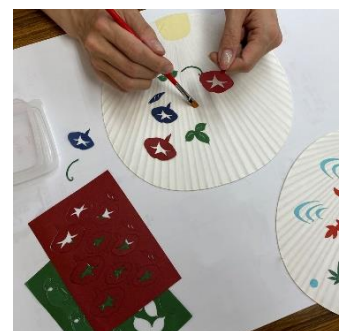
京うちわ 和紙貼り絵絵付け 体験（京うちわ塩見） 2,000 円／20～40 分