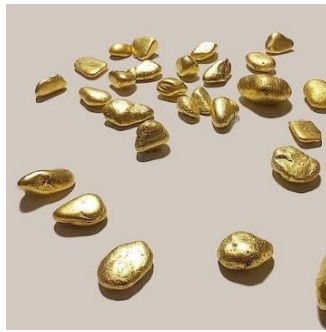
金箔でペーパーウェイト作り体験 （京金箔押 常若） 1,500 円～／15～25 分