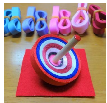
京こま作り体験 （京こま雀休） 2,500 円／30 分