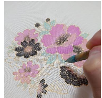
手描友禅「色挿し」（彩色）体験 （染工房正茂） 3,500 円／60 分