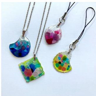
七宝体験 (京七宝ヒロミ・アート) 2,500円 (小) / 3,500円 (大) 30~60分