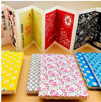
御朱印帳・豆本作り体験 (株式会社西川紙業) 2,000円~/30分

※ワークショップの体験内容・時間・価格は変更する場合がございます。あらかじめご了承ください。