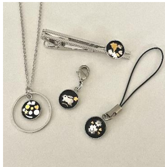
象嵌体験（中嶋象嵌） 2,500 円／40 分