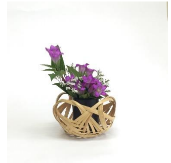
竹工芸体験 (長岡銘竹株式会社) 2,000円~/20~30分