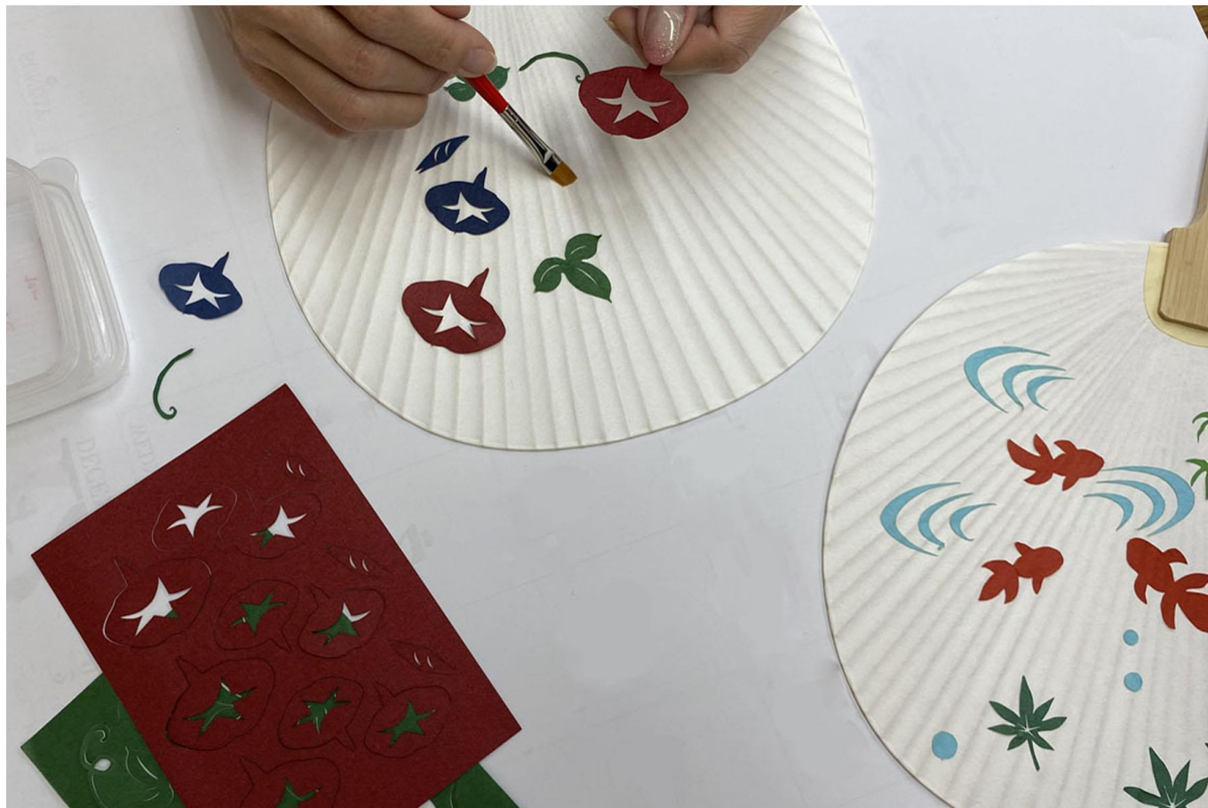
画像：京うちわ 貼り絵付け体験（京うちわ塩見）イメージ

本イベントでは、入場無料（体験は料金1,000円～、時間15分～）で京友禅や竹工芸など、伝統工芸にまつわる様々なワークショップを気軽に体験することができます。今回は、暑い夏を乗り切るのにぴったりな京うちわに和紙を貼り、絵付けする体験や日常でお使いいただける小物が作れるなど、お子様でも簡単にできるワークショップを多数ご用意しております。また、今回は、親子で体験できるコーナーとして地蔵盆体験を実施いたします。夏休み期間中の開催ですので、ぜひご家族でご参加ください。