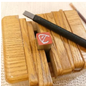
石のハンコ作り・篆刻体験 (河政印房) 3,000円/30~60分