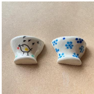
陶芸 絵付け体験 (瑞希工房) 1,000 円 ~ / 20~30 分