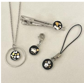
象嵌体験 (中嶋象嵌) 2,500円~/40~60分