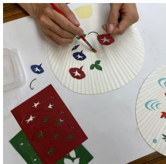
京うちわ 和紙貼り絵付け体験 (京うちわ塩見) 2,000 円 / 20~40 分