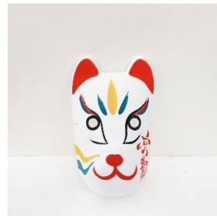
だるま絵付け体験・狐面 絵付け体験・念珠ブレス レット作り (あかね屋) 2,000 円 / 45~60 分

ホテル M3F クラフト & アートショップ「アトリエジャパン」でも同日にワークショップを実施