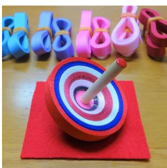
京こま作り体験 (京こま雀休) 2,500円/30分