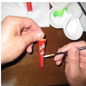
和蝋燭絵付け体験 (有限会社中村ローソク) 1,500円/30分