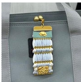
絨(おどし)体験 (工房武久) 4,000円/30~50分