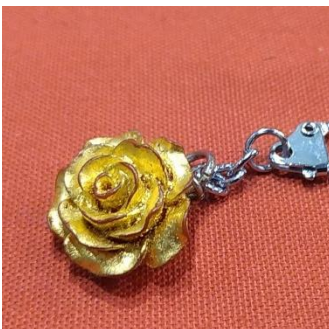
金箔貼り体験 (京金箔押 常若) 1,500円~/20~40分