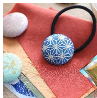
金彩体験 (takenaka kinsai) 1,000円/30分