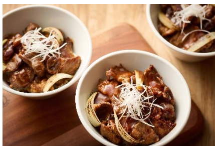
ジンギスカン丼（ランチ限定） ラム肉と玉ねぎを濃厚タレで味付けした北海道の郷土料理ジンギスカン丼。