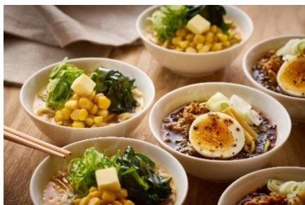
ご当地ラーメン（ディナー限定） 北海道と富山で有名な味噌ラーメンとブラックラーメンをシェフが再現したメニューが登場！