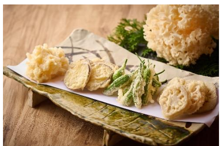
ル・タン風天ぷら 福井県の九頭竜まいたけや石川県のさつまいも五郎島金時などを天ぷらにしてご提供。