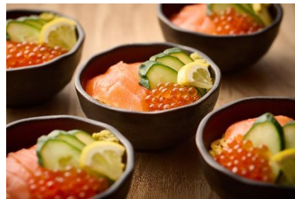
海鮮丼（ランチ限定） 北の恵みサーモンといくらを使った色鮮やかなどんぶりをご用意します。