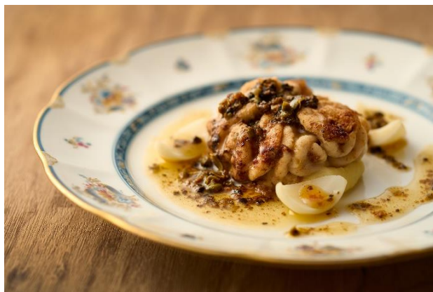
画像：シェフの一皿イメージ SUKIYAKI トリュフ風味（左）、鱈の白子のムニエル トリュフ風味（右）