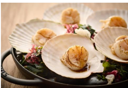
ホタテ貝のオープン焼き バター、醤油とともにオープンで香ばしく焼き上げたホタテ貝も食べ放題。