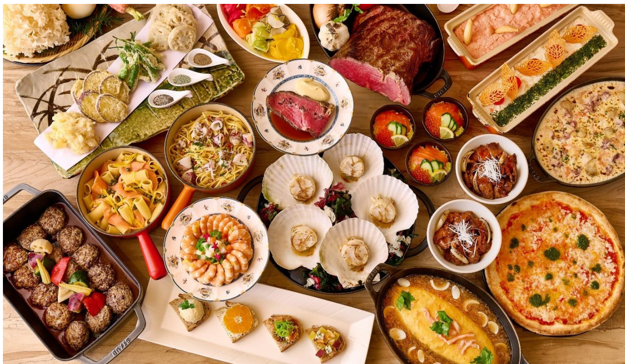
画像：北海道×北陸「北の恵み」バイキング 料理イメージ

食べ放題のメニューには、北海道と北陸ともにご当地グルメとして有名なラーメンの食べ比べがディナーに登場。ランチ限定メニューでは北海道の名物料理ジンギスカンや海鮮のどんぶりが充実しています。