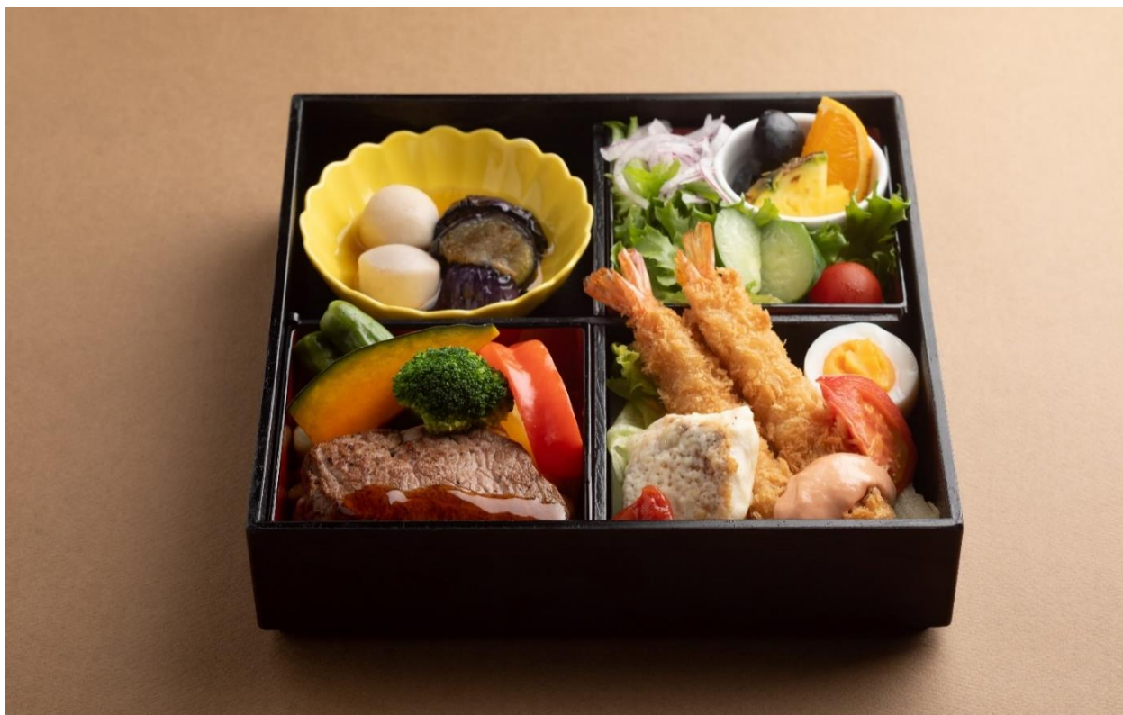
画像：ハラル洋食弁当イメージ

尚、近隣の礼拝スペースのご提案や、ご宿泊のお客様は全客室にメッカの方角を記す方位表を備えており、お祈りマットのご用意も可能です。