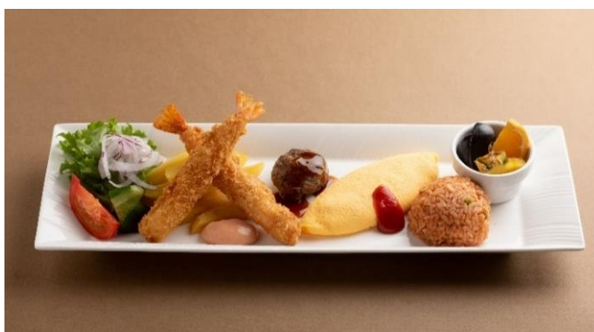
画像：ハラルチキンのグリル(左)、ハラルキッズプレート(右) イメージ