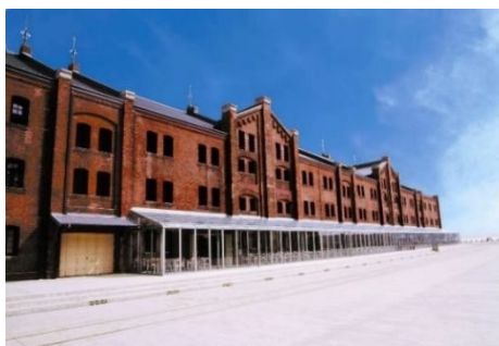
<横浜赤レンガ倉庫>

横浜赤レンガ倉庫は、2022年5月9日(月)より設備メンテナンスに伴う大規模改修工事のため休館いたします。なお、休館期間中も、毎年たくさんの方に楽しんでいただいている季節の恒例イベントは引き続き開催いたします。