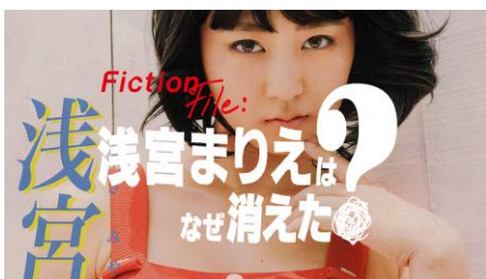
映画・ドラマ出演 ※過去の活動含む