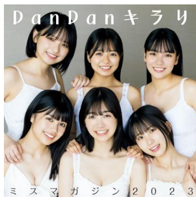
オリジナル楽曲 ※過去の活動含む