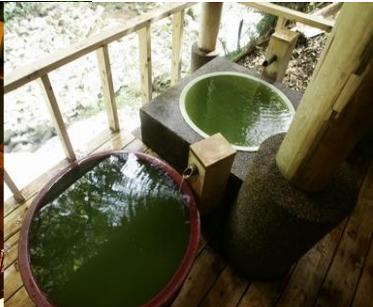
日本唯一のお抹茶風呂