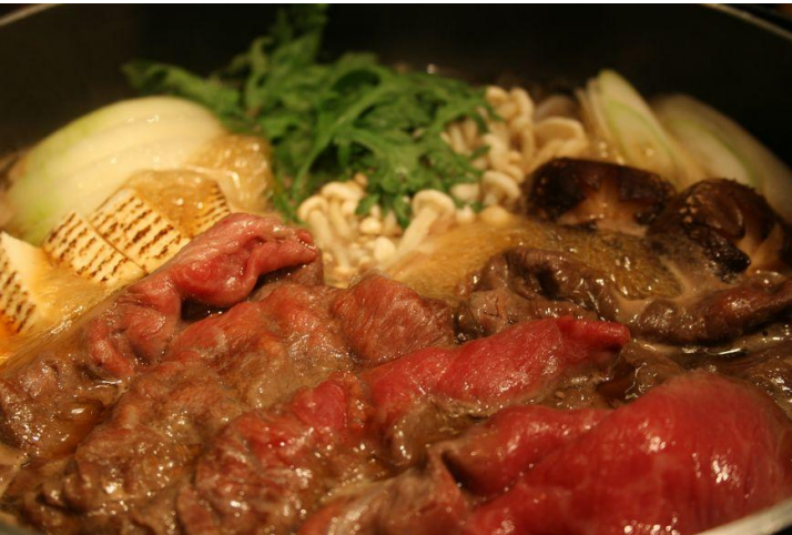
定額給付金プランのお食事・あしたか牛のすき焼き