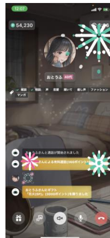
通話中に送れるギフト演出