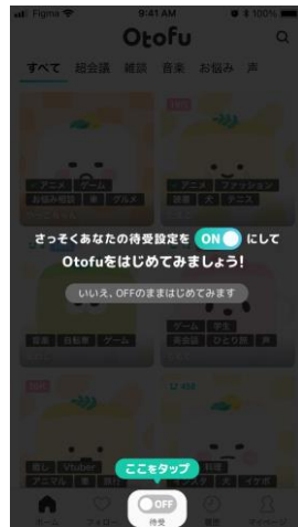
待受のON/OFFで着信設定