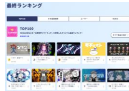
ボカコレランキング

「The VOCALOID Collection（ボカコレ）」は、ボーカロイド文化のさらなる発展を目指す記念日として、「ニコニコネット超会議」からスピンアウトしたイベントです。「The VOCALOID Collection ~2024 Winter~」では、いわ、なきそ、かいいきべア、など総勢55名のアーティストが参加し、「ボカロDJ」などの恒例の人気企画をはじめ、協力会社・メディアパートナーとのコラボ企画や特番など、様々な企画を実施しました。