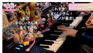
作者と巡回！ MMD&演奏してみたツアー