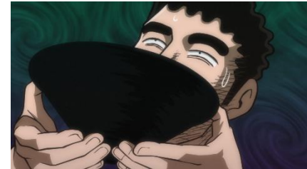
▲第 2 話「回転寿司の流儀」