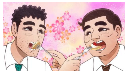
▲第 5 話「パンケーキの流儀」