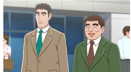
▲第 1 話「マグロ丼の流儀」

同率 5 位は「マグロ丼の流儀」（第 1 話）より、後輩の川口が遠慮なく高い海鮮丼を注文するシーンです。ひろしが川口に昼メシをごちそうするために、名物のマグロ丼を提供する店を訪れる回で、川口も同じメニューを選ぶと思いきや、その倍の値段がする海鮮丼を迷いなく注文します。予想外の選択と海鮮丼の金額に驚くひろしに対し、視聴者からは「！」「わかる」「それは驚く」など、共感のコメントが寄せられていました。