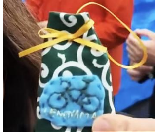
▲自転車安全お守り