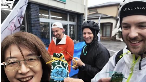
▲サイクルショップ（山形県）

また、青森県大間町の飲食店では、提供された「大間のマグロ丼」のボリュームに驚愕しながらも全員見事に完食。出発の際には、店主から旅のエールとして地元産のリンゴが贈られるなど、温かな声援を受ける姿も見られました。