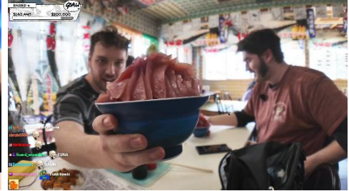
▲大間のマグロ丼（青森県）