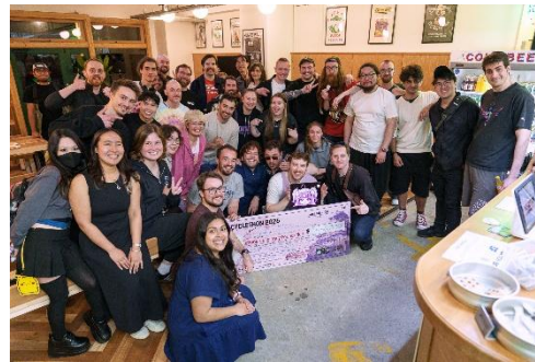
▲ゴールに集まったファン（大阪府）