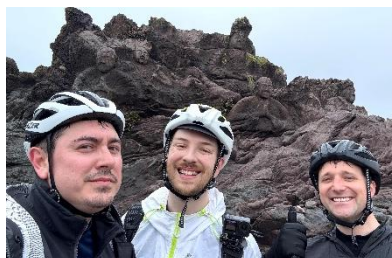
▲十六羅漢岩（山形県）