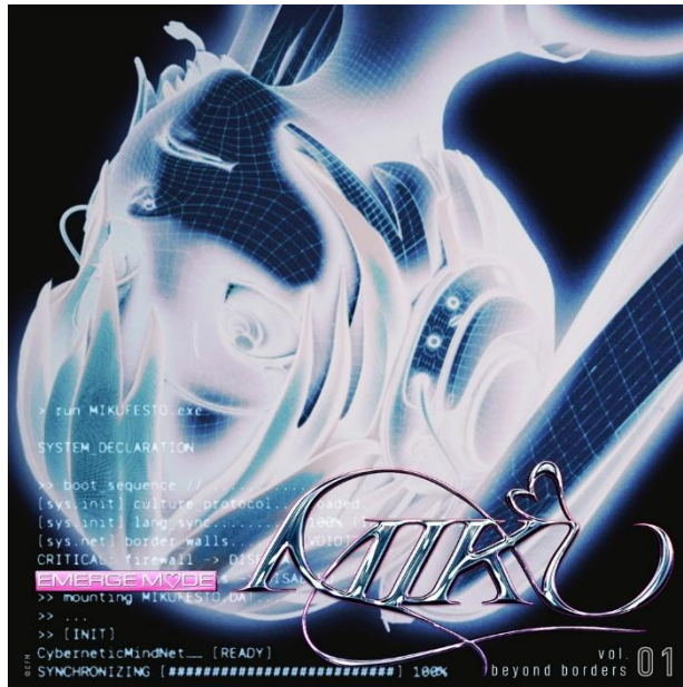
「EMERGE M♡DE MIKU」キービジュアル

株式会社ドワンゴは、アメリカ・ロサンゼルスで開催された「Anime Expo」のステージイベント「JAPAN MUSIC VOCALOID」（2026年7月4日開催）において、同社が推進する国内外トップクリエイターによるボカロ楽曲共同制作プロジェクト「BEYOND BORDERs」のコラボレーション EP 第1弾「EMERGE M♡DE MIKU」およびオフィシャルトレーラーを初公開しました。あわせて、本プロジェクトに参加するコラボレーターおよび制作陣を発表しました。