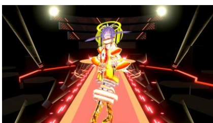
アバターアワード 2022 アバター部門 優秀賞受賞作品：「REIRO12th 魔態遍照」