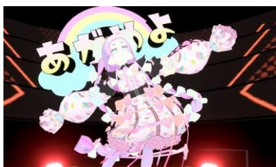
アバターアワード 2022 アバター部門 最優秀賞受賞作品：「amele」

募集部門は、アバターを評価する「アバター部門」とアバター同士の交流が伝わる写真を評価する「アバターライフ部門」の 2 部門です。また、今回は株式会社 HIKKY と協力し、同社が主催する大型 VR イベント「Vket 2023 Winter」（開催期間：2023 年 12 月 2 日～12 月 17 日）の会場にて、最終審査ノミネート作品の人気投票で決める「ユーザー賞」を新設します。