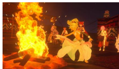
アバターアワード 2022 アバターライフ部門 受賞作品：「REIRO12th 魔態遍照」