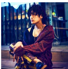
赤飯 (オメでたい頭でなにより/コロナメモモ)