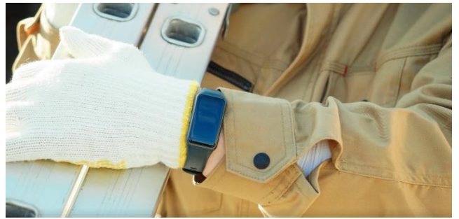
事業所・部署・現場ごとの健康状態を可視化

「Assista」は睡眠の分析に特化したウェアラブルデバイスを用いて取得したデータを解析し、従業員の健康状態を可視化、機械学習を用いて疾病リスクを抽出し、予防するサービスです。従業員にウェアラブルデバイスを装着してもらうことで、睡眠・心拍数・血中酸素濃度・歩数・ストレス値・移動距離・座り過ぎアラートなどのデータを取得・確認できます。取得したデータはAIで解析し、リスクの高い従業員を抽出、管理者へ通知します。管理者は、リスクの高い従業員へ産業医や心理カウンセラーとの面談を設置するなど、スムーズな健康管理への対応につなげることができます。