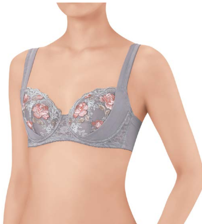
【着用商品】 品番：NB-2760 カラー：GY（グレー）