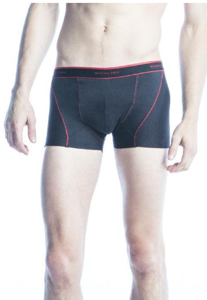
写真：「WACOAL MEN」『JUST FIT BOXER すそピタ』

全国の百貨店、ワコールウェブストアなどで販売し、1万枚の売上を目指します。(2014年7月～12月)