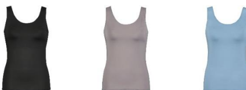
BL(ブラック)・OC(カカオ)・TU(ターコイズ)