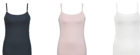
LB(ラズベリー)・PO(ピーチ)・IV(アイボリー)