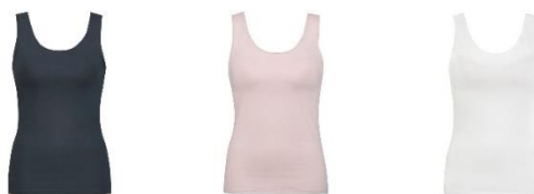
LB(ラズベリー)・PO(ピーチ)・IV(アイボリー)