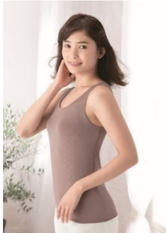
ウイング『くるしゅうない』 品番：ET-1151 カラー：OC（カカオ）

株式会社ワコールは、チェーンストア（量販店）向けブランド「ウイング」より、アンダーゴムの締め付けを軽減したブラトップ『くるしゅうない』を2月上旬より発売します。