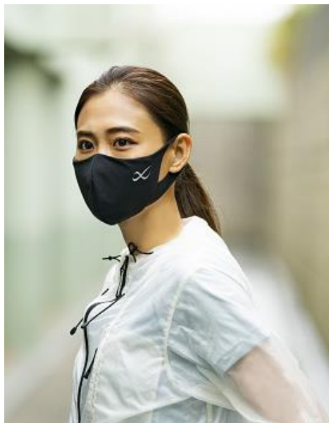
『CW-X SPORTS MASK for light exercise』

(※) 取り扱い店舗や各店舗発売日は以下URLをご確認ください。 https://www.cw-x.jp/news/news202010/hyr700.html