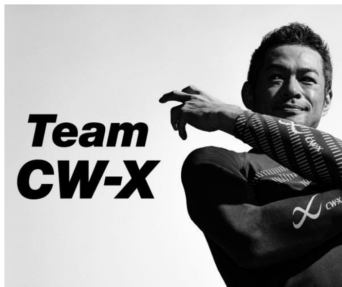
初代キャプテン イチローさん

ICHIRO × CW-X 特設サイト：URL： https://www.cw-x.jp/teamcw-x/ichiro/