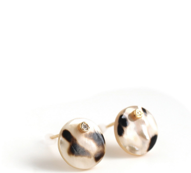
l'unique ピアス 46,200円（税込）