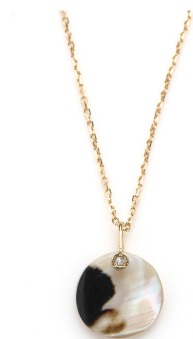
l'unique ネックレス 79,200円（税込）