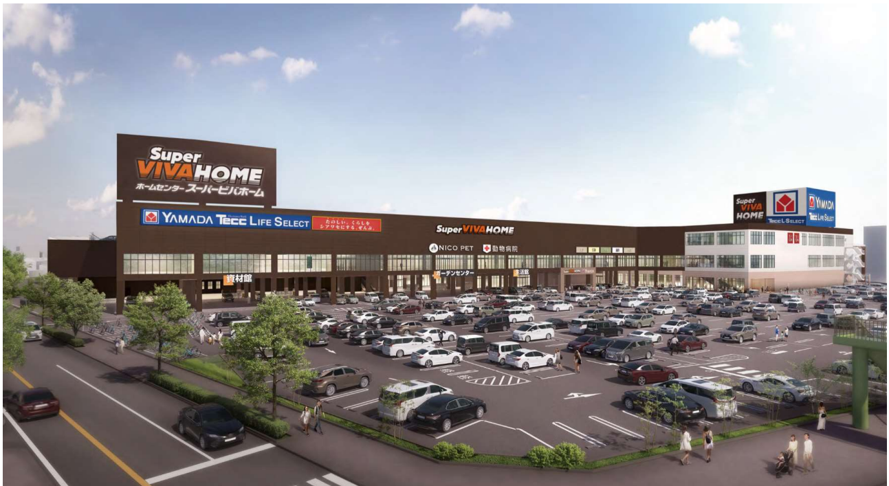
<「スーパービバホーム一宮店」パース>

約720坪のスーパーマーケットは、品質・鮮度の良い「安全安心」な商品はもちろんのこと、減塩や糖質オフをはじめとした健康に配慮した商品、利便性・簡便性を高めた商品、「新鮮」で「安心」の店内「できたて」手づくり商品、平和堂こだわりブランド「E-WA!」等の豊富な品揃えと、愛知県や一宮市を中心とした地元商品を多数取り揃えます。また、飲食のできる休憩エリア「138 Brunch COURT」や、旬の食をご提案する「移動式クッキングサポート」等の設備・サービスとともに、お客様の毎日の食卓や生活のお役に立つ店舗として、最高の「おもてなし」を実現してまいります。