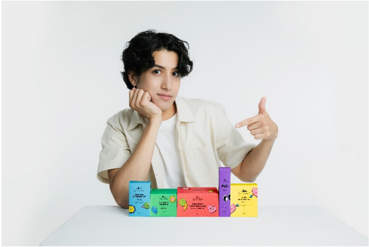
[写真] VT×kemio PLANET EDITION SPECIAL BOX 4,642円(税込)

圧倒的な発信力を誇るクリエイターkemioとVTによる特別なコラボレーション「プラネット エディション」が実現。VTの大人気商品である「VT CICA デイリースージングマスク(30枚入り)」「VT CICA マイルド トナーパッド」、今年新たに注目を集めている「VT CICA マイルドアイクリーム」やお試しミニサイズの「クレンジングセット」と「スキンケアセット」の豪華5点が入ったオリジナルボックスです。