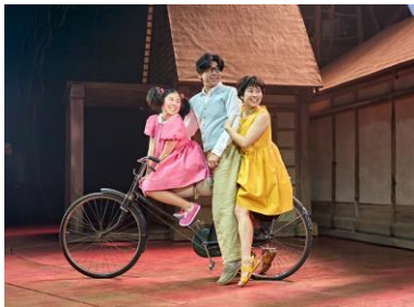
Mei (Victoria Chen), Tatsuo (Dai Tabuchi) and Satsuki (Ami Okumura Jones) in My Neighbour Totoro.