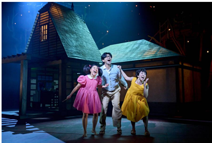
無期限ロングラン公演が開幕したMy Neighbour Totoro

エグゼクティブ・プロデューサー：久石譲 原作：宮崎駿「となりのトトロ」 音楽：久石譲 脚色：トム・モートン＝スミス 演出：フェリム・マクダーモット 製作：日本テレビ/ロイヤル・シェイクスピア・カンパニー