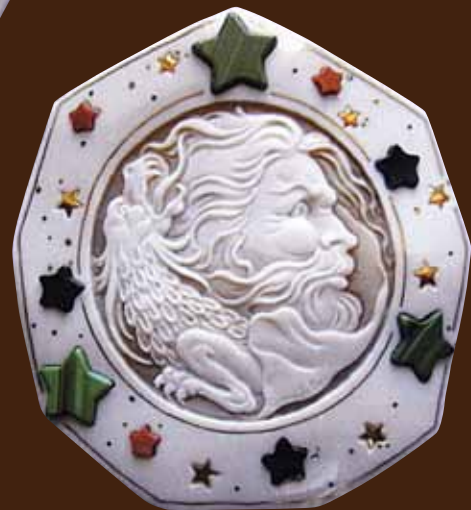
ヘスペリデスの庭のラドン