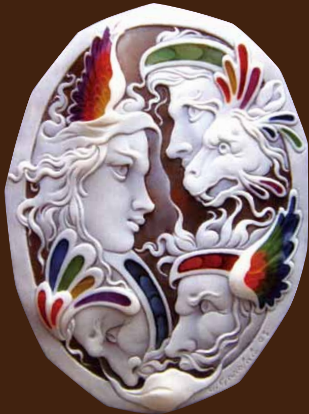
アントロポモロフィック(神人同形的)・ヴィジョン