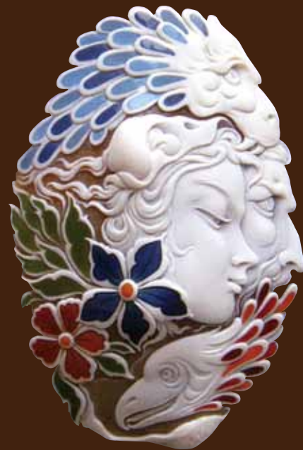
次々と変わりゆく気分