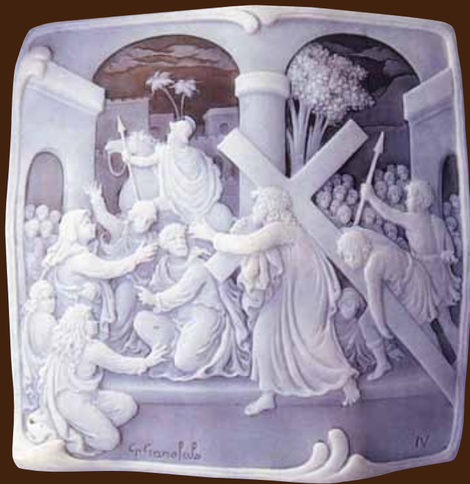
十字架の道行 第四留 母マリアと出会うイエス