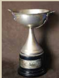
職人芸術コンクール： 優勝トロフィー

クラシックに始まり、パツネッジョの表現、ミケランジェロ風の老人の顔、手の表現、女性の顔、仮面のアレゴリーなどが熟成した彫刻技術によって表現され、これまでの集大成と言える作品である。