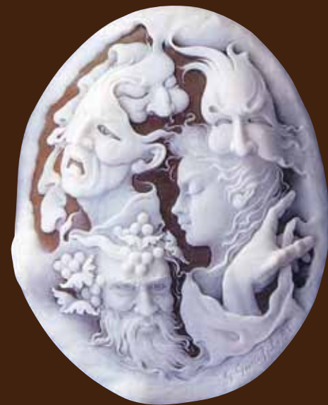
ひとつのピリオド 1991