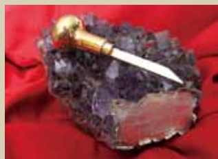
最優秀賞：金の彫刻刀