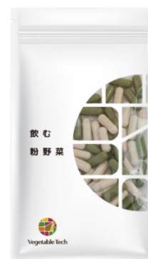
飲む粉野菜（ケール・人参葉・ ごぼうミックス）