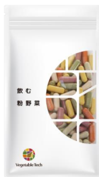
飲む粉野菜 (9種の野菜)