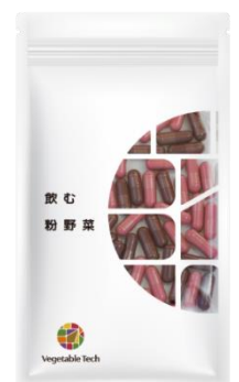
飲む粉野菜（赤紫蘇 ・紫人参・紅大根ミックス）