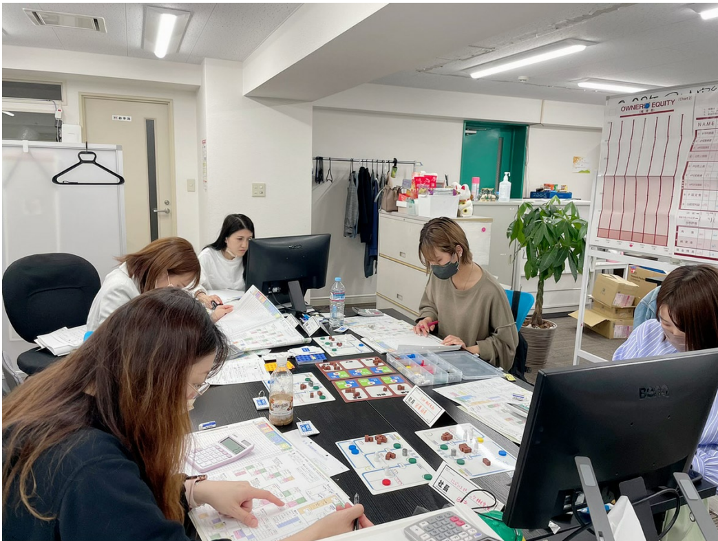
全員で決算タイム

1期が終了する毎に、決算書の損益計算書(P/L)や貸借対照表(B/S)等を、自分の手で計算し、作成することによって、企業経営を数値でとらえ、理解することが出来ます。