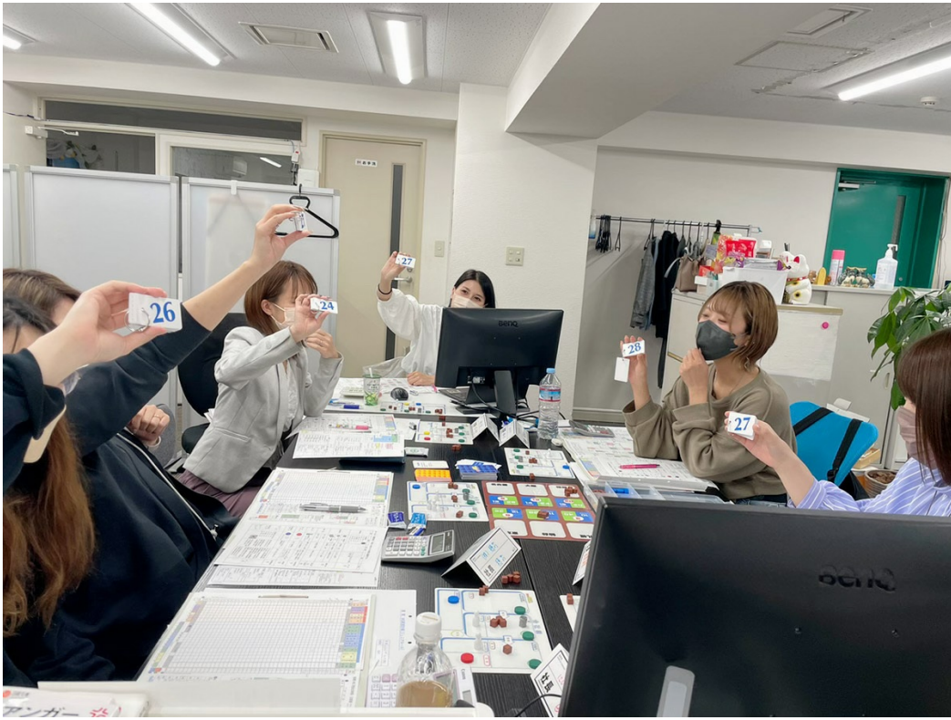
入札中。安い価格を提示した会社の商品が売れるので駆け引きが重要

1期が終了する毎に、決算書の損益計算書(P/L)や貸借対照表(B/S)等を、自分の手で計算し、作成することによって、企業経営を数値でとらえ、理解することが出来ます。