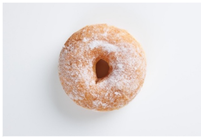
• 5 Minutes(シュガー)