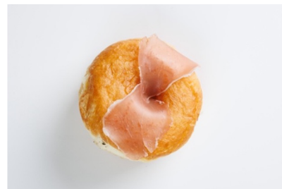
• Every Morning (生ハムマッシュポテト)