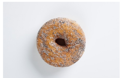
• Pump It(セサミ)