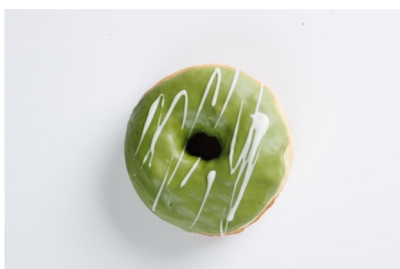
• 東京キッド(抹茶チョコ)