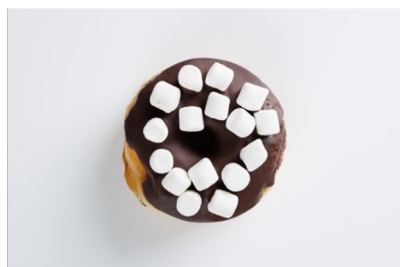
• Dancing Queen (マシュマロ&チョコ)