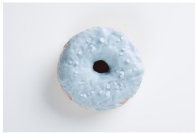
• Surfin' U.S.A.(シーソルト)