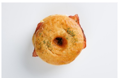
• Sunny Hours (ベーコン&エッグタルタル)