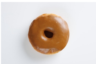
• Bittersweet Samba (コーヒー)