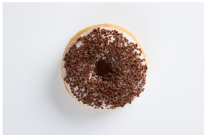
• Black or White (ホワイトチョコランチ)