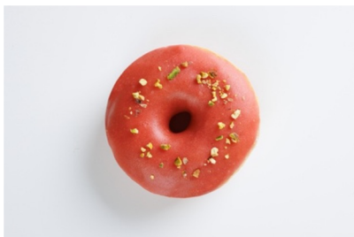
• First Love(ストロベリー)