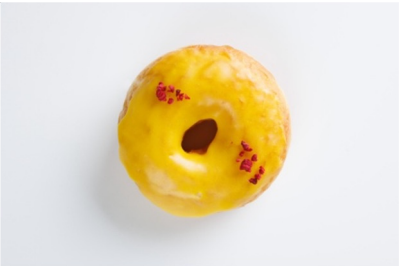
• Shake It Off(バナナ)