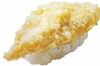
北海道水揚げ ほっけの天ぷら握り 100 円 (税込 110 円)