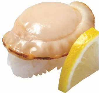
北海道噴火湾産 大粒ほたて 160 円 (税込 176 円)