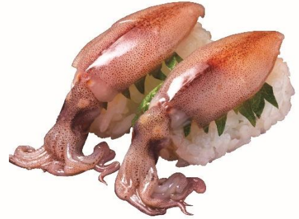
富山湾産 大振り生ほたるいか 210 円 (税込 231 円)