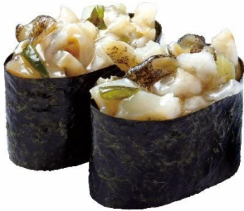
北海道産つぶ貝のわさび和え 160 円 (税込 176 円)