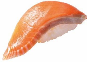
北海道産サーモン 100 円 (税込 110 円)