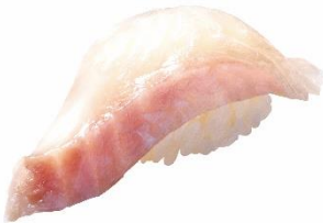
愛媛県宇和島産くえ 290 円 (税込 319 円)