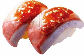
ごま寒ぶり 150 円 (税込 165 円)