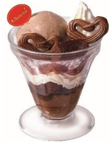
口どけガーナジェラートの濃厚チョコパルフェ 380 円 (税込 418 円)