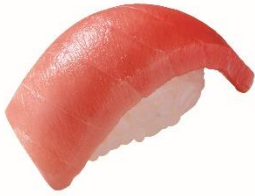
みなみまぐろ中とろ 100 円 (税込 110 円)