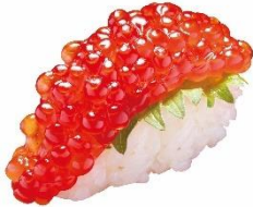
紅鮭すじこ 150 円 (税込 165 円)