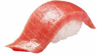
和歌山県産大切り本 まぐろ 中とろ 290 円 (税込 319 円)