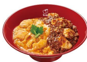
麻婆豆腐親子丼（並盛）