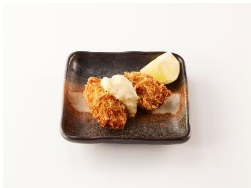
ランチ広島県産牡蠣フライ 350 円 (税込 385 円)

この秋登場した「広島県産牡蠣フライ」をランチ限定価格で販売するほか、濃厚な味わいが寒い季節にぴったりな「北海道産紅ズワイガニのクリームコロッケ」を1個からご提供します。