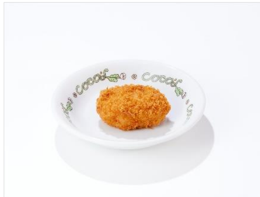
ランチ北海道産紅ズワイガニのクリームコロッケ 180 円 (税込 198 円)