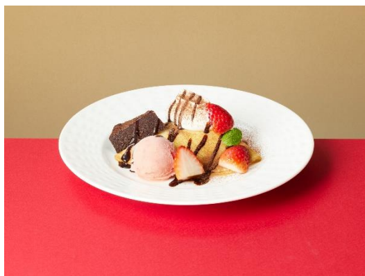
いちごとチョコのクレープ 590 円 (税込 649 円) 濃厚なチョコプリンと優しい甘さのホイップを、もちもちのクレープで包みました。フレッシュないちごの真っ赤な色やストロベリーシャーベットのピンク色が明るく可愛い印象を与えます。ガトーショコラやふわとろホイップなどの様々な食材とクレープの組み合わせをお楽しみください。

ワッフルコーンは単品でも販売しますので、みんなでシェアしてお楽しみいただくのもおすすめです。