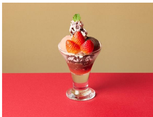
いちごとチョコのミニパフェ 490 円 (税込 539 円) お手頃がいちごとチョコを楽しめる、食後にぴったりなサイズのミニパフェです。フレッシュないちごと 2 種のアイスを、サクサクのココアビスケットなどと一緒に楽しめる、小さいながらも満足感のあるパフェに仕上げました。