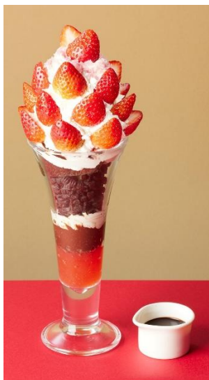
いちごとチョコのクイーンパフェ 1,680 円 (税込 1,848 円)