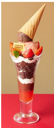
いちごのトリプルアイスパフェ 1,080 円 (税込 1,188 円)