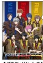
◆前半ディビジョン集合