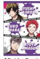
◆Bad Ass Temple