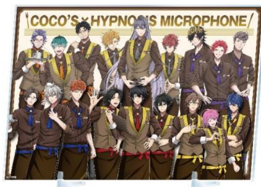
ココスオリジナルアクリルボード サイズ：約 W29.7cm×H21.0cm (スタンド脚付き)