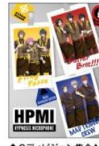
◆6ディビジョン集合A