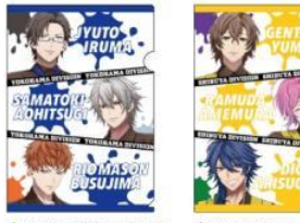
◆MAD TRIGGER CREW