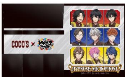
＜布巻ケース：前半デザイン＞ サイズ 本体：約 W30.0cm×H18.2cm