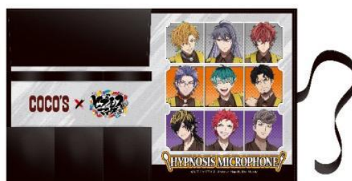
＜布巻ケース：後半デザイン＞ サイズ 本体：約 W30.0cm×H18.2cm