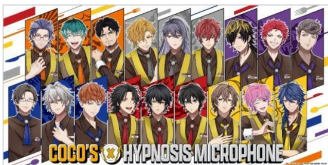
ココスオリジナルバスタオル サイズ：約 W120.0cm×H60.0cm