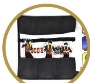
アコースタ入れに♪