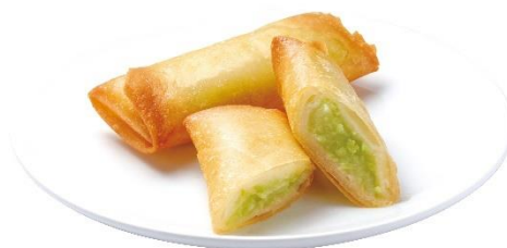
パリパリずんだ春巻 (2 本) 220 円 (税込 242 円)