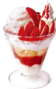
berry cute ないちごパルフェ 430 円 (税込 473 円)