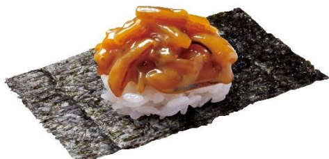
北海道産アカイカのうに和えつつみ 160 円 (税込 176 円)