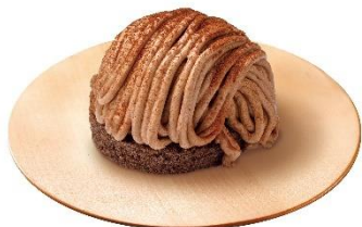
生チョコモンブラン 270 円 (税込 297 円)