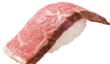
いわて牛五ツ星握り 290 円 (税込 319 円)