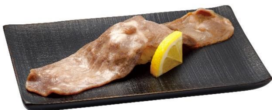
直火焼き牛たん握り 390 円 (税込 429 円)