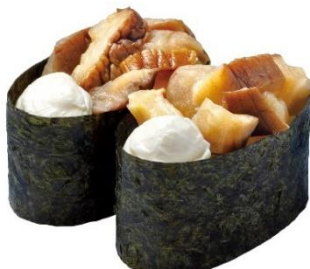
いぶりがっこクリームチーズ軍艦 160 円 (税込 176 円)