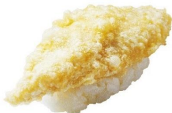
北海道水揚げ ほっけの天ぷら握り 100 円 (税込 110 円)