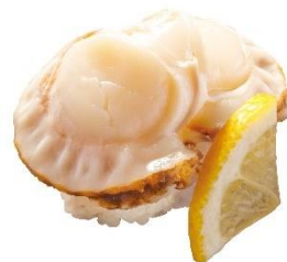
青森県産 大粒蒸しほたて 160 円 (税込 176 円)