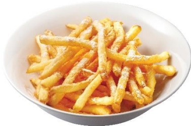
カリカリポテト (焦がしにんにく醤油味) 270円 (税込 297円)