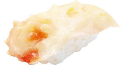
タラバガニのふんどし 210円 (税込 231円)