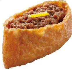
和牛そぼろいなり 160円 (税込 176円)