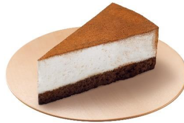
ティラミスケーキ (北海道産マスカルポーネ使用) 270円 (税込 297円)