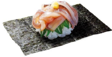
青森県産 漬けいか耳つつみ 100円 (税込 110円)