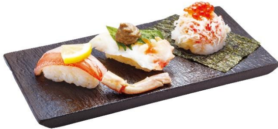
かに三味 ・ずわいがにつつみ (いくらのみせ) ・タラバガニのふんどし (大葉かにみそのせ) ・生本ずわいがに 720円 (税込 792円)