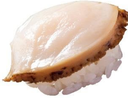
あわび 160円 (税込 176円)