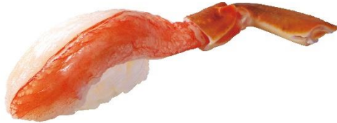
生本ずわいがに 290円 (税込 319円)