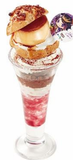
闇ノシュウの Yummy な闇色シュウプリンパフェ ~ブルーベリーソースもおいしゅう~ 990 円 (税込 1,089 円)

アイクの好物であるハンバーガーにキャラカラーを入れて、ココス風にアレンジしました。ココスのジューシーなハンバーガーと香り高いベーコン、濃厚なチェダーチーズをブラックバンズで挟んだハンバーガーは食べ応え抜群です。付け合わせの、アイクが好きなチーズ風味のスナック菓子と一緒に楽しみください。