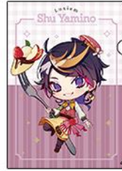
◆闇ノシュウ (ミニキャラ)