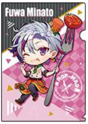
◆不破湊 (ミニキャラ)