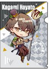
◆加賀美ハヤト (ミニキャラ)