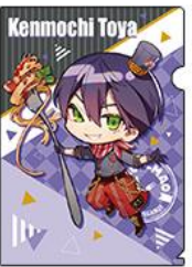
◆剣持刀也 (ミニキャラ)