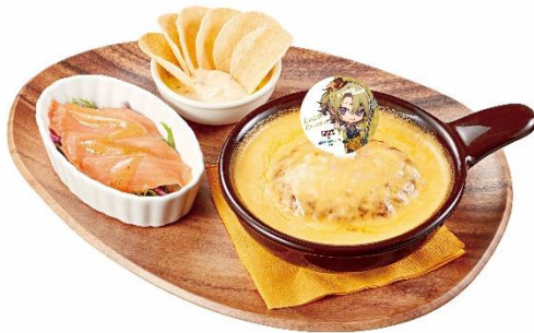
ポグ ボスのゴールデンPOG! ハンバーグドリア ～サーモンカルパッチョも添えて～ 1,190 円 (税込 1,309 円)

トップにミスタを型どった、カラカラーのオレンジ色が目を惹くかわいらしいパフェです。パフェの中層はミスタが好きなチョコアイスやチョコプリンに、カラカラーをイメージした爽やかな味わいのオレンジソースを合わせており、コクがありながらもさっぱりとした味わいをお楽しみいただけます。ミスタが好きなフレッシュキウイも入れました。パリパリ食感のシュガースプレーやサクサクのチョコクリスピーで食感もお楽しみください。