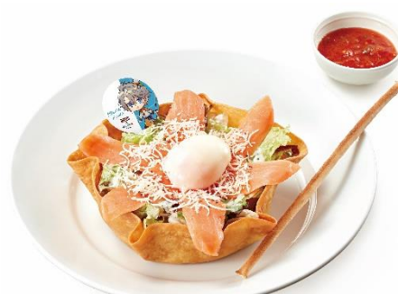
かいだはる 甲斐田晴の太陽 SUNSUN 晴れサラダ ～いだはるステッキで応援！～ 1,090円(税込1,199円)

ふわみなとの好物ハニートーストを、バーチャルホストにふさわしい華やかな見た目に仕上げました。サクサクふわふわなデニッシュ生地の上に、いちごやリンゴ、キウイ、バナナなどのフルーツを華やかに飾り付け、はちみつをかけた商品です。一口食べればバターが広がるデニッシュと甘酸っぱい爽やかなフルーツ、バニラアイスの組み合わせは相性抜群。お好みで別添えのはちみつをさらにかけてお召し上がりください。