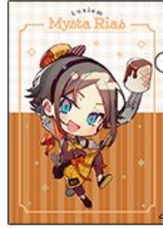
◆ミスタ・リアス (ミニキャラ)