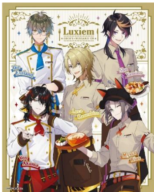
ココスオリジナルキャラファインボード ルクシム Luxiem ver.

対象メニュー1品のご注文につき「ココスオリジナルキャラファインボード ルクシム Luxiem ver.」と「ココスオリジナルキャラファインボード ろふまお ROF-MAO ver.」が各 230 名様に当たる WEB 抽選に応募できます。対象メニューをご注文いただいたお客様のレシートに応募コードが印字されます。