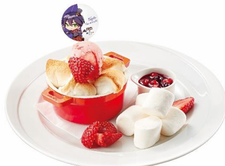
けんもちとうや 剣持刀也のマシュマロ大量スモア ～ブルーベリーソースを添えて～ 990円(税込1,089円)

かがみハヤトがかいだはるのトマト嫌いを克服するために作ったアクアパッツァをココス風にアレンジしました。まるまる1尾の鯛やあさりなどの魚介、トマトやマッシュルーム、オリーブ、ブロッコリーなどの野菜を包み焼きにし、旨みを閉じ込めました。開けた瞬間タイムの爽やかな香りが広がり食欲をそそります。コラボ限定の【ROF-MAO】オリジナルホイルで包んで提供します。