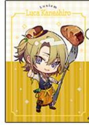
◆ルカ・カネシロ (ミニキャラ)