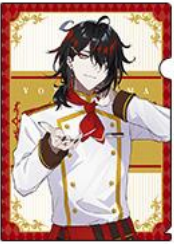
◆ヴォックス・アクマ