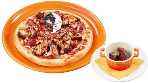
おにから 貴方の舌を溶かす ヴォックス様の鬼辛サルサ Pizza ～チョコスイーツもつけたぞ～ 1,090 円 (税込 1,199 円)

鬼のヴォックスをイメージした鬼辛いピザが登場します。ピリっと辛いサルサソースをベースに、チョリソーやカリブチキン、唐辛子を使用したピZZAは、後引く辛さがクセになる味わいです。ヴォックスのようにエレガントな気分を味わっていただけるよう、ガトーショコラもセットでご用意しました。ドリンクバーのご注文でヴォックスが好きな紅茶を合わせれば、より美味しくお召し上がりいただけます。