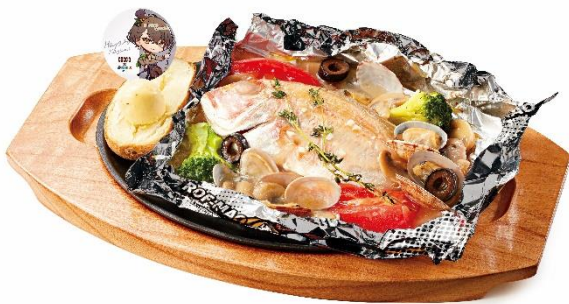
かがみ 加賀美ハヤトのあの日のおもてなしアクアパッツァ ～ココス Ver.でございます～ 1,190円(税込1,309円)

かがみハヤトがかいだはるのトマト嫌いを克服するために作ったアクアパッツァをココス風にアレンジしました。まるまる1尾の鯛やあさりなどの魚介、トマトやマッシュルーム、オリーブ、ブロッコリーなどの野菜を包み焼きにし、旨みを閉じ込めました。開けた瞬間タイムの爽やかな香りが広がり食欲をそそります。コラボ限定の【ROF-MAO】オリジナルホイルで包んで提供します。