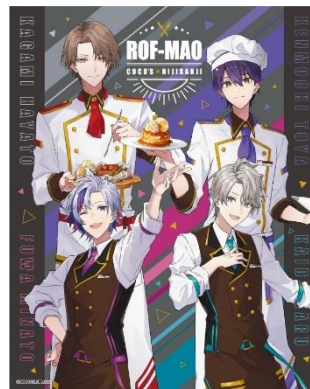
ココスオリジナルキャラファインボード ろふまお ROF-MAO ver.