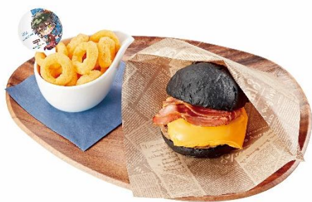
Good Smell ! アイクのブラックハンバーガー ~スナックも一緒に~ 1,190 円 (税込 1,309 円)

アイクの好物であるハンバーガーにキャラカラーを入れて、ココス風にアレンジしました。ココスのジューシーなハンバーガーと香り高いベーコン、濃厚なチェダーチーズをブラックバンズで挟んだハンバーガーは食べ応え抜群です。付け合わせの、アイクが好きなチーズ風味のスナック菓子と一緒に楽しみください。