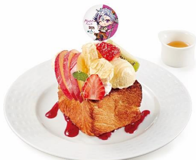
ふわみなと 不破湊のフルーツ盛りハニートーストタワー ～俺とレッツパーリー☆～ 990円(税込1,089円)

ふわみなとの好物ハニートーストを、バーチャルホストにふさわしい華やかな見た目に仕上げました。サクサクふわふわなデニッシュ生地の上に、いちごやリンゴ、キウイ、バナナなどのフルーツを華やかに飾り付け、はちみつをかけた商品です。一口食べればバターが広がるデニッシュと甘酸っぱい爽やかなフルーツ、バニラアイスの組み合わせは相性抜群。お好みで別添えのはちみつをさらにかけてお召し上がりください。