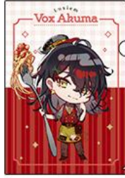
◆ヴォックス・アクマ (ミニキャラ)