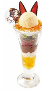
コン イミット KON INNIT! かわいいミスタパフェ ～ビッグマグナム級～ 990 円 (税込 1,089 円)

鬼のヴォックスをイメージした鬼辛いピザが登場します。ピリっと辛いサルサソースをベースに、チョリソーやカリブチキン、唐辛子を使用したピZZAは、後引く辛さがクセになる味わいです。ヴォックスのようにエレガントな気分を味わっていただけるよう、ガトーショコラもセットでご用意しました。ドリンクバーのご注文でヴォックスが好きな紅茶を合わせれば、より美味しくお召し上がりいただけます。