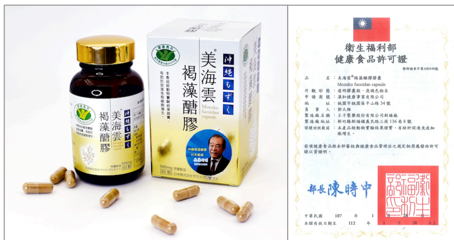
▲左：商品外装、右：「健康食品」許可証