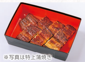
※写真は特上蒲焼き