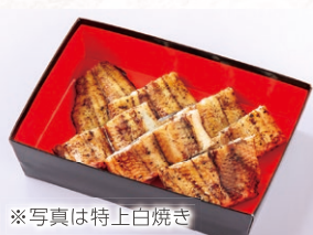
※写真は特上白焼き