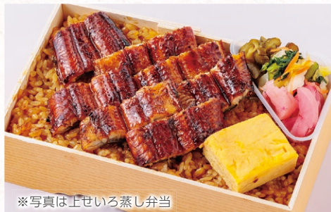
※写真は上せいろ蒸し弁当

特選ひつまぶし弁当 4,800円 上ひつまぶし弁当 4,200円 ひつまぶし弁当 3,400円 うなぎ蒲焼き・吸物・漬物・ごはん だし汁・薬味五種