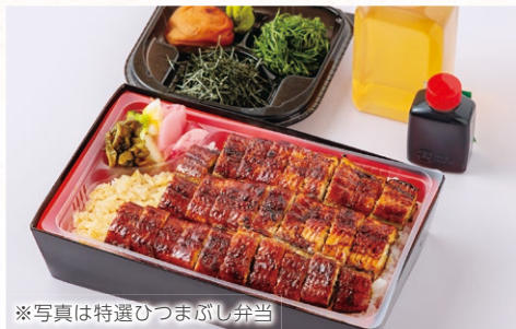
※写真は特選ひつまぶし弁当

特選ひつまぶし弁当 4,800円 上ひつまぶし弁当 4,200円 ひつまぶし弁当 3,400円 うなぎ蒲焼き・吸物・漬物・ごはん だし汁・薬味五種