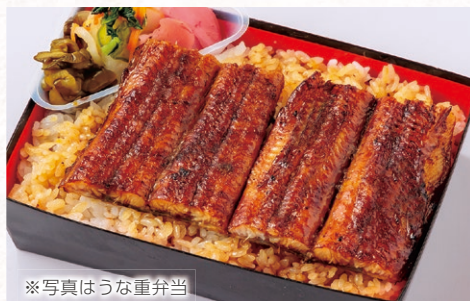
※写真はうなぎ重弁当

特選うなぎ弁当 4,800円 特上うなぎ弁当 4,200円 うなぎ弁当 3,600円 うなぎ蒲焼き・吸物・漬物・ごはん