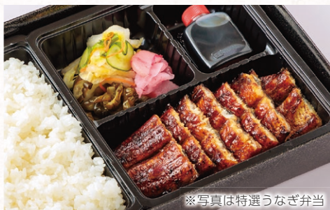
※写真は特選うなぎ弁当

上せいろ蒸し弁当 3,900円 せいろ蒸し弁当 3,100円 うなぎせいろ蒸し・だし巻き玉子・吸物 漬物・ごはん