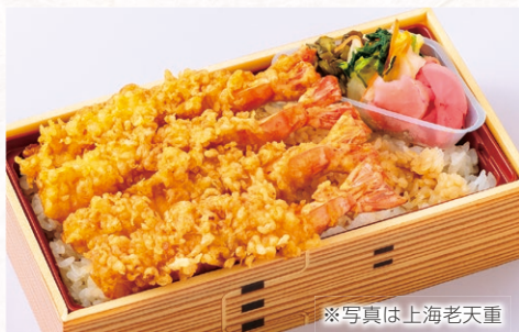
※写真は上海老天重

うなぎ重弁当 3,600円 上うなぎ弁当 3,000円 うなぎ弁当 2,400円 うなぎ蒲焼き・吸物・漬物・ごはん